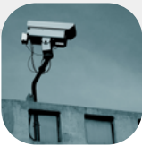
경비(일반, 특수, 기계)